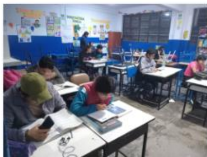
WhatsApp Image 2023-06-30 at 10.08.07 PM