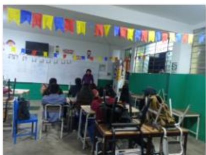
WhatsApp Image 2023-06-30 at 10.07.50 PM