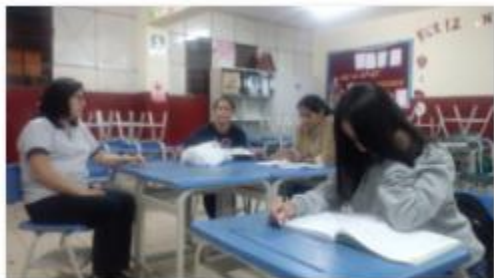
WhatsApp Image 2023-06-30 at 7.21.33 PM