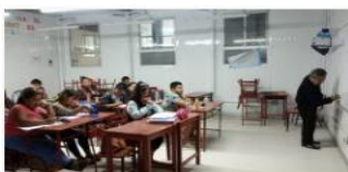
WhatsApp Image 2023-06-30 at 7.54.40 PM