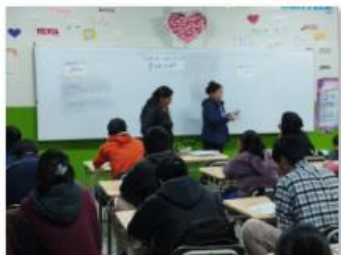
WhatsApp Image 2023-06-30 at 9.52.34 PM (1)