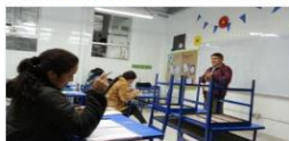
WhatsApp Image 2023-07-03 at 11.25.29 AM (1)