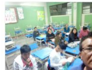
WhatsApp Image 2023-06-30 at 7.33.09 PM