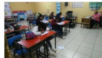
WhatsApp Image 2023-06-30 at 7.46.54 PM