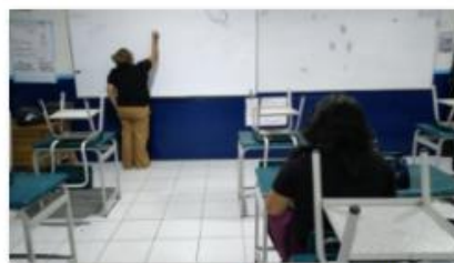
WhatsApp Image 2023-06-30 at 7.13.18 PM