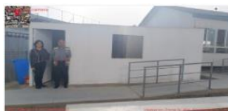
WhatsApp Image 2023-06-30 at 4.17.40 PM