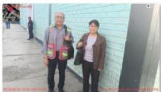
WhatsApp Image 2023-06-30 at 4.53.16 PM