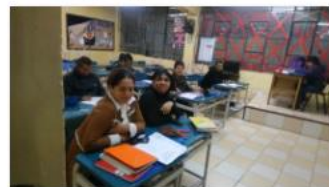
WhatsApp Image 2023-06-30 at 7.49.55 PM