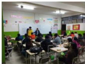
WhatsApp Image 2023-06-30 at 9.52.34 PM