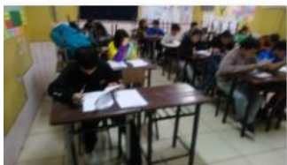
WhatsApp Image 2023-06-30 at 7.48.11 PM