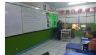
WhatsApp Image 2023-06-30 at 7.32.27 PM