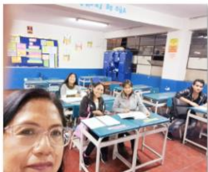
WhatsApp Image 2023-06-30 at 10.05.00 PM