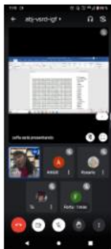
WhatsApp Image 2023-07-03 at 11.48.27 AM