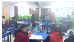
WhatsApp Image 2023-06-30 at 7.28.59 PM