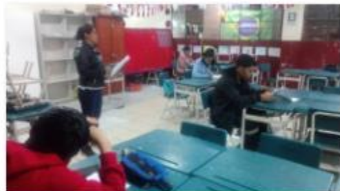
WhatsApp Image 2023-06-30 at 7.23.07 PM