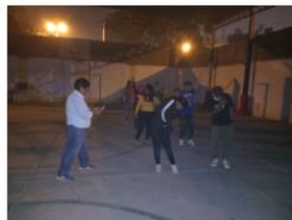
WhatsApp Image 2023-06-30 at 10.09.16 PM