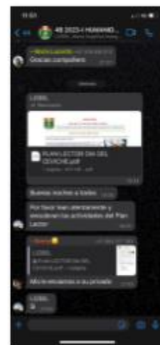
WhatsApp Image 2023-07-03 at 11.51.56 AM