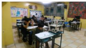
WhatsApp Image 2023-06-30 at 7.49.10 PM