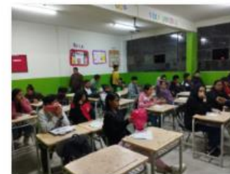
WhatsApp Image 2023-06-30 at 9.52.35 PM