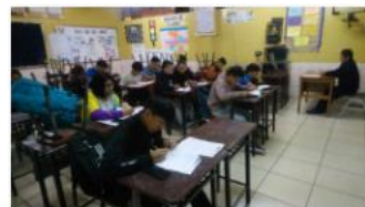
WhatsApp Image 2023-06-30 at 7.46.21 PM