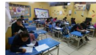
WhatsApp Image 2023-06-30 at 7.47.10 PM