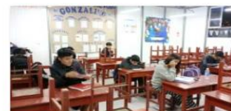
WhatsApp Image 2023-06-30 at 7.55.17 PM