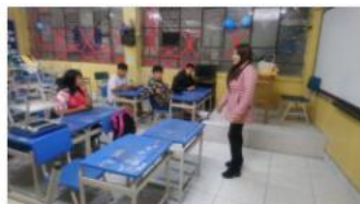
WhatsApp Image 2023-06-30 at 6.31.18 PM