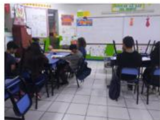
WhatsApp Image 2023-06-30 at 7.22.29 PM