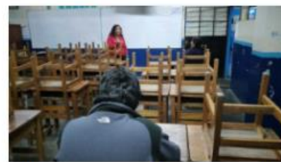
WhatsApp Image 2023-06-30 at 7.15.19 PM