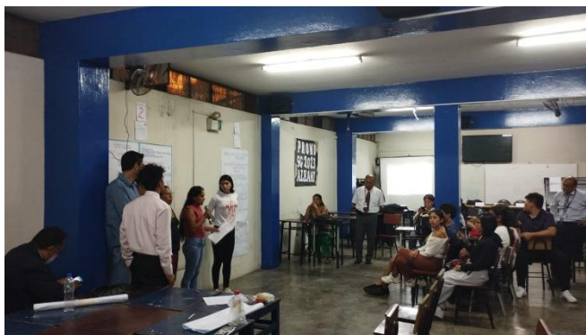
EXPOSICION DE PROPUESTA DE LA LISTA 2