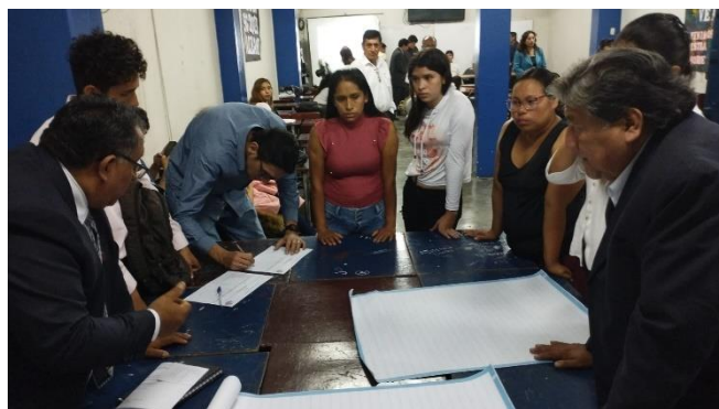
ELABORACION DE PROPUESTA DE LA LISTA 2