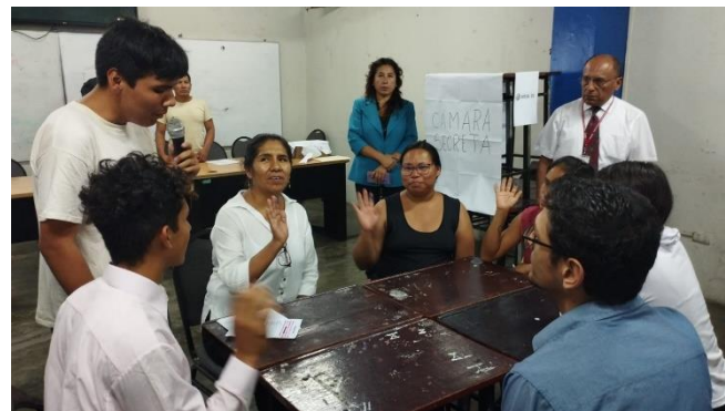
ACTO DE JURAMENTACION DE LISTA GANADORA