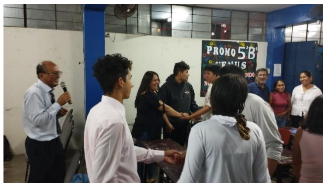
FORMACION DE GRUPOS DE TRABAJO