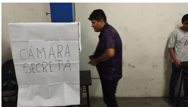
ACTO DE VOTACION DE MESA