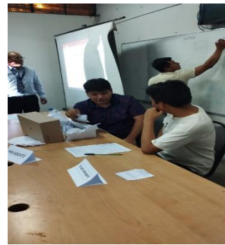
ACTO DE ESCRUTINIO