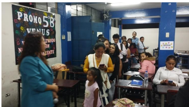
ESPERANDO TURNO PARA VOTACION