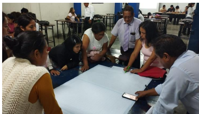
ELABORACION DE PROPUESTA DE LA LISTA 1