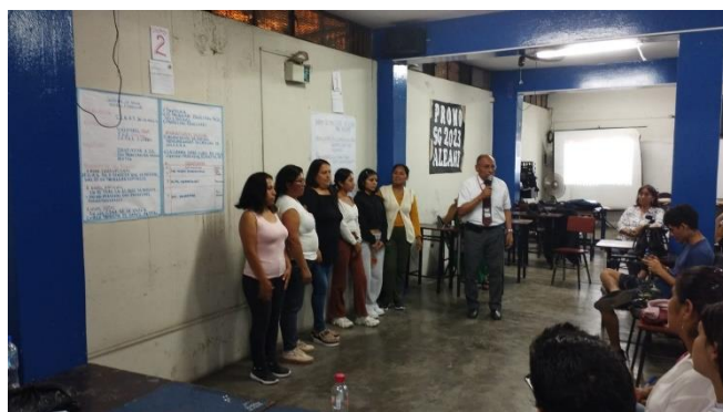
EXPOSICION DE PROPUESTA DE LA LISTA 1