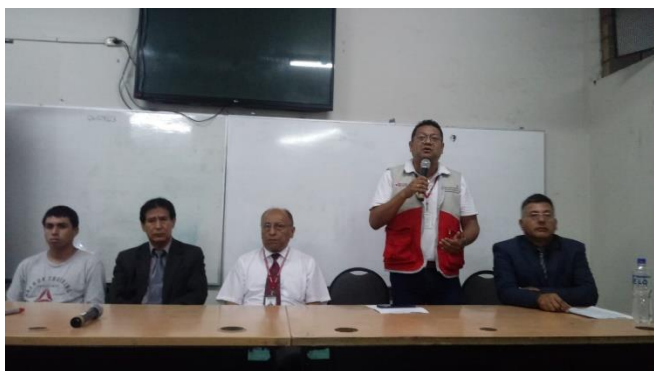
REPRESENTANTE DE LA DRELM