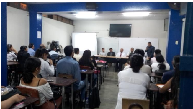
PRESENTACIÓN DEL ACTO Y DE AUTORIDADES