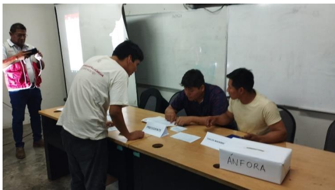
VOTACION DE LOS MIEMBROS DE MESA