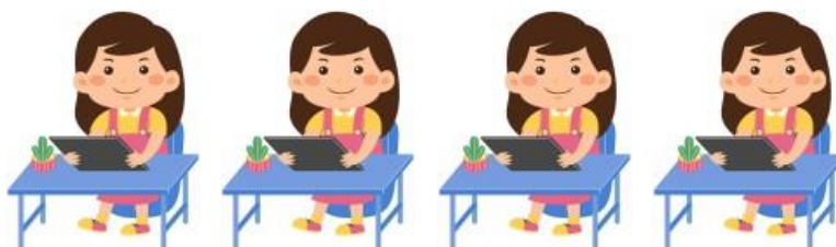
Aula u otro entorno