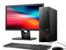
Ordenador de sobremesa

Los dispositivos que pueden utilizarse para las pruebas son los siguientes: