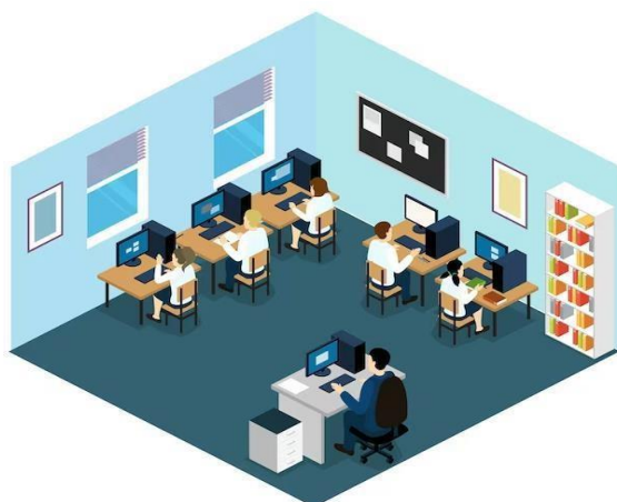
Sala de ordenadores (Grupo 1 en uso)

En el caso de que la unidad educativa no disponga de suficientes ordenadores para cada alumno, se deberán formar grupos de alumnos y permitirles la entrada de forma escalonada una vez que cada grupo haya terminado la prueba, garantizando así que todos los alumnos puedan realizar el examen.