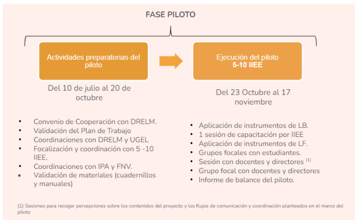
Figura 1: Actividades Programa Piloto